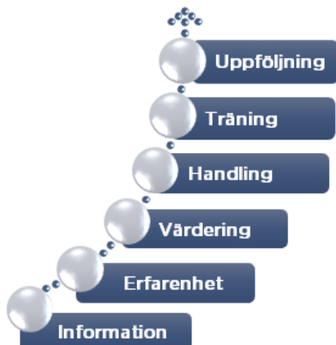
Trappmodellen för informationsöverföring och bearbetning av värderingar och attityder.

Vi håller både öppna och företagsinterna utbildningar. Kunskap är grunden till faktabaserade beslut och en förutsättning för att skapa engagemang hos ledning och personal. Kunskap är en del i våra metoder för att ändra beteende. Det räcker ofta inte med att bara tillföra information för att få människor att handla annorlunda.